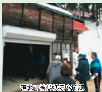
現地で被災状況を確認

3月12日未明に発生した長野県北部地震で大きな被害のあった大島区では、地域協議会委員が即座に現地へ赴き、被害状況を確認しました。その後、復興支援について地域協議会