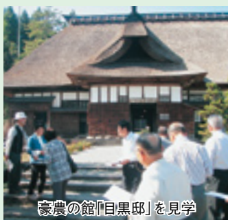
豪農の館「目黒邸」を見学

9月29日に南魚沼市・魚沼市への視察研修を実施しました。北越急行(株)社長から、ほくほく線の歴史や黒井駅停車問題について話を聞いたほか、国指定重要文化財の目黒邸や