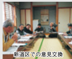
新道区での意見交換

町内会、住民組織、まちづくり団体など、地域で活動する団体と地域協議会が、地域の課題や解決策などについて意見交換する取り組みが始まっています。住民の皆さんが地域の課題を共有することを通じて、よりよいまちづくりに向けた取り組みにつながることが期待されます。